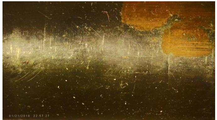
Kuva 2 Puristerengas ei auetessa ole rikkonut kromausta koko putken halkaisijalta. Löysä liitos.