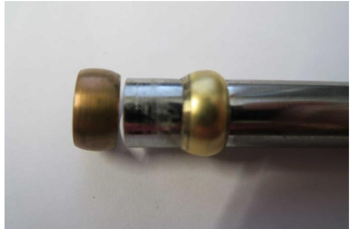
Kuva 4 Ohessa kiristysohjeen mukainen kiristys ja muodonmuutos puristus renkaassa. Vieressä kohteesta otettu puristerengas, hyvin pieni muodonmuutos, ei kiristynyt tarpeeksi.