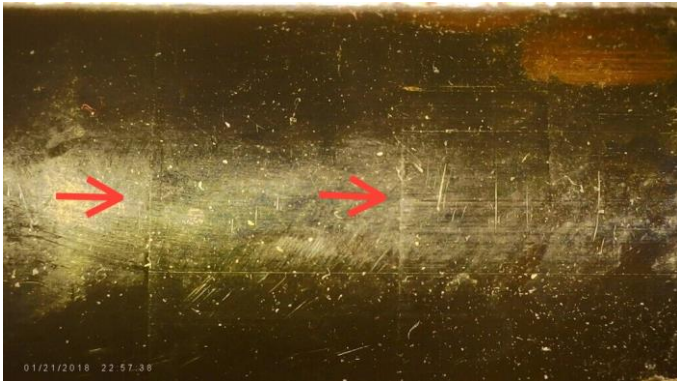
Kuva 3 Putkessa havaittavissa heikot kiristysjäljet